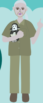
Dr. Jane Goodall

Jane Goodall, mulai meneliti simpanse di Afrika pada tahun 1960, beliau memberikan penjelasan tentang induk simpanse sebagai berikut: