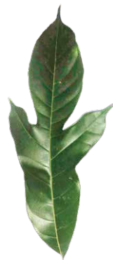
PANTY RANAK パンティ ラナック