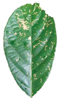
MEDANG KELADI メダン ケラディ