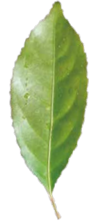
MENDO KING メンドキン